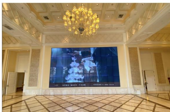
4-2 LED 螢幕廣告 (3F大會報到處旁)